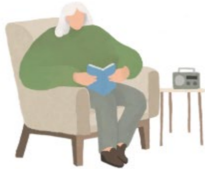
Digitalt tilsyn på dag