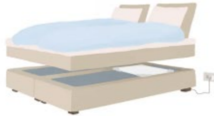
Digitalt tilsyn på natt