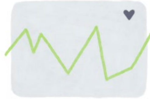
Søvnanalyse og helse rapporter